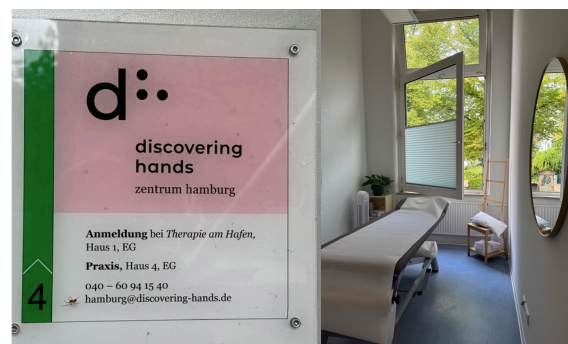
Einer der Untersuchungsräume des DH-Zentrums in Hamburg

Terminvereinbarung : https://tinyurl.com/3hwhyxhc admin@pretac.ch