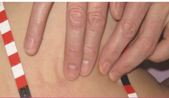
Sensibilité élevée de l'examen tactile des seins

discovering hands® a remporté de nombreux prix en Allemagne, en Autriche et en Belgique.